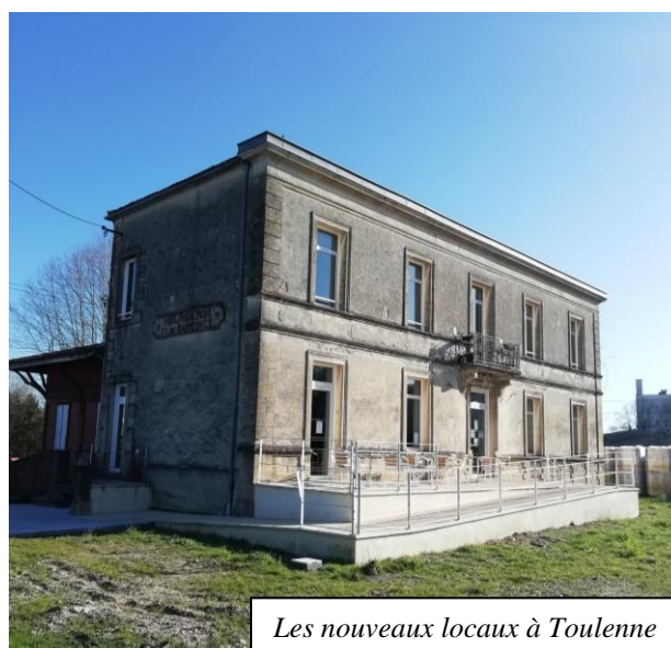
Les nouveaux locaux à Toulenne

Notre public est constitué principalement de ménages ou personnes précaires avec ou sans domicile stable. La plupart ont une activité de travailleurs agricoles saisonniers. Ils sont de nationalité française (principalement de culture manouche) ou bien sont saisonniers agricoles européens (principalement espagnols, portugais, italiens, roumains de culture roms) .