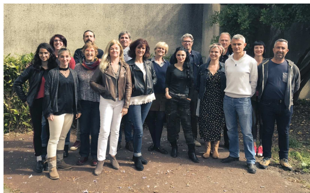
Une partie de l'équipe de professionnels de l'ADAV33

La moyenne d'âge des salariés est de 46,5 ans , l'ancienneté moyenne de 11,3 ans (de 4 mois à 27 ans d'ancienneté).