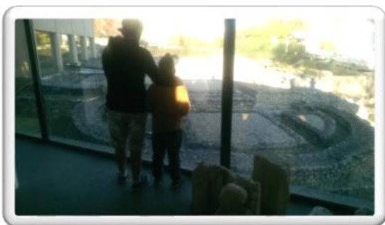
Visite du site archéologique de Montcaret

Une concrétisation est escomptée au second semestre 2017.