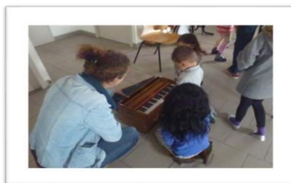
Contact avec l'intervenant éveil musical à Libourne