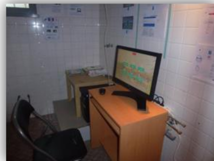
Borne tactile en accès libre

En septembre, Emilie GASCON, jeune CESF, est venue renforcer l'équipe pour quelques mois dans le cadre d'un service civique. Sa mission est d'accompagner les usagers vers l'outil numérique lors des temps d'accueil du public et de proposer des temps spécifiques afin de former ou de préparer les bénéficiaires au progressif basculement vers la dématérialisation. Les ateliers de prise en main de la borne ont démarré fin octobre 2016 et sont prévus jusqu'avril 2017, date de fin de mission pour le service civique.