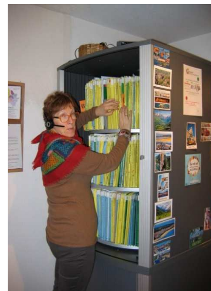
Accueil domiciliation au siège à Talence