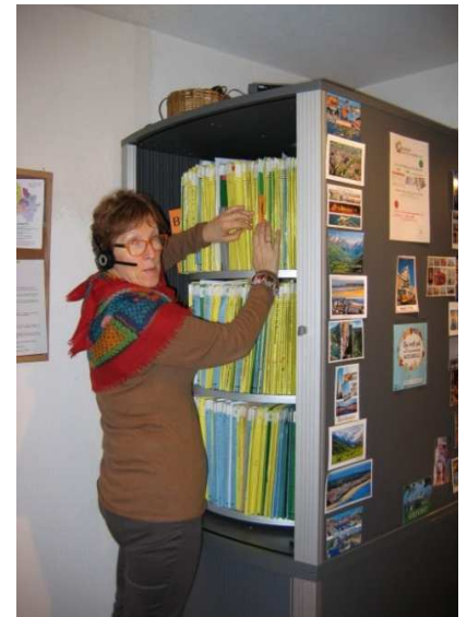
Accueil domiciliation au siège à Talence