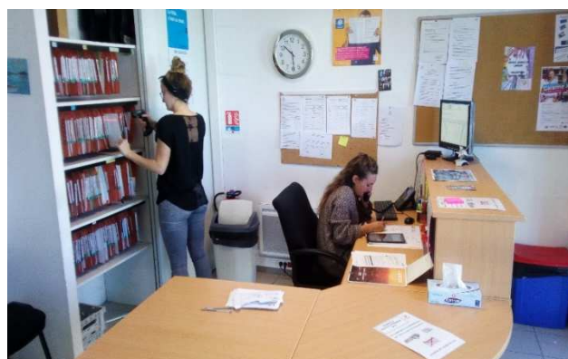
Accueil à l'antenne de Langon