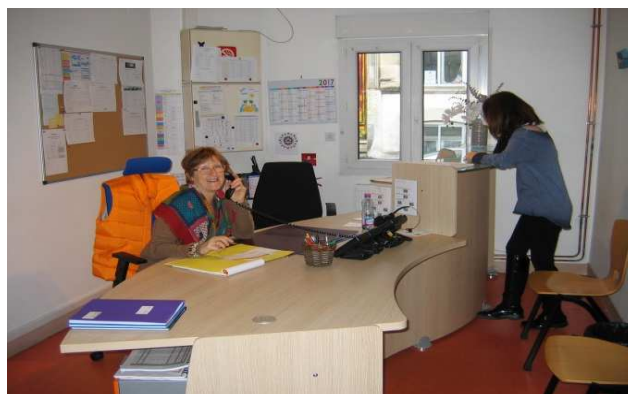
Accueil à Talence