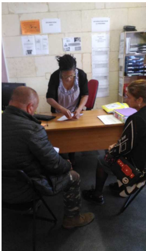
Accueil à l'antenne de Libourne