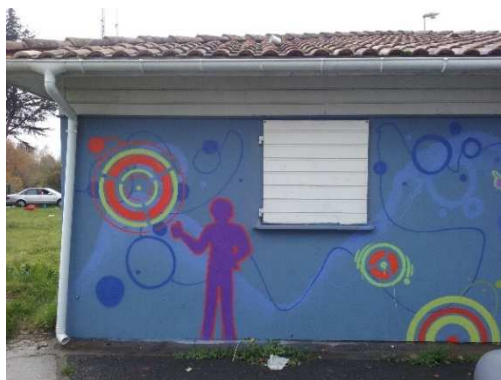
Graff local Aire d'Accueil Saint-Médard-en-Jalles