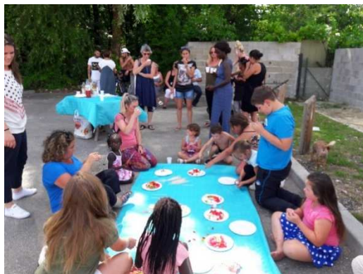
Comité de Locataires Maou Ha