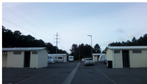
Aire de Biganos