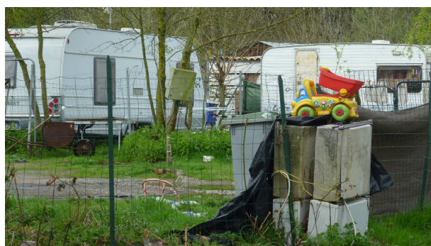
Quartier Raclet Saint Christoly de Blaye ▶