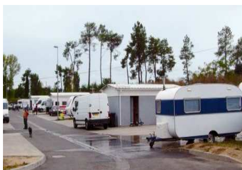
◀ Aire d'accueil de Saint André de Cubzac