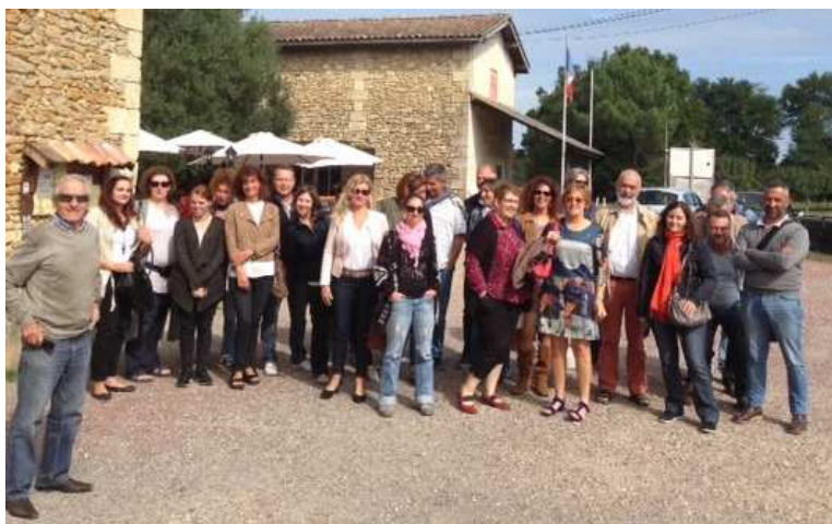
L'équipe de professionnels avec des administrateurs en séminaire dans le Sud-Gironde

La moyenne d'âge des salariés est de 47 ans , l'ancienneté moyenne de 10.5 ans (de 3 mois à 26 ans d'ancienneté).