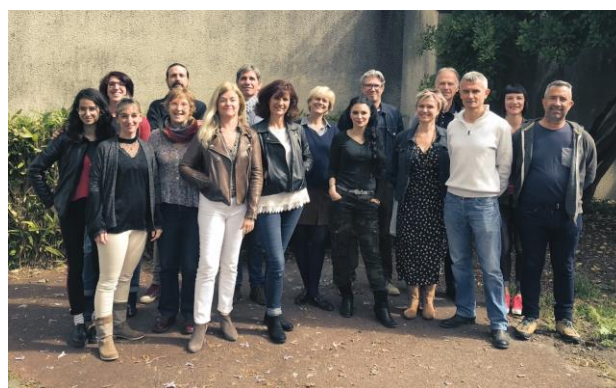
Une partie de l'équipe de professionnels de l'ADAV33

La moyenne d'âge des salariés est de 46,8 ans , l'ancienneté moyenne de 11,83 ans (de 3 mois à 29 ans d'ancienneté).