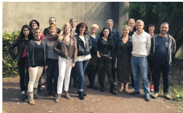
Une partie de l'équipe de professionnels de l'ADAV33

La professionnelle la plus récente a 2 mois d'ancienneté, le plus ancien 28 ans.