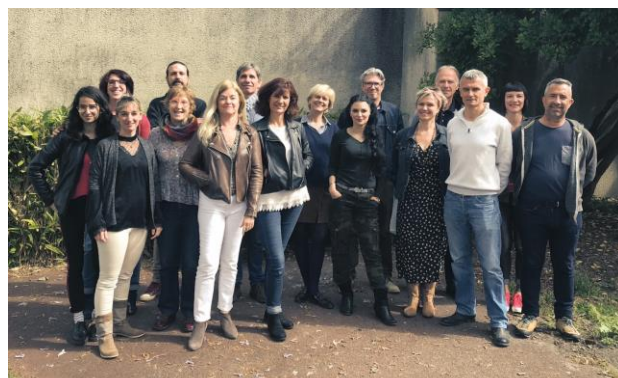
Une partie de l'équipe de professionnels de l'ADAV33

La professionnelle la plus récente a 3 mois d'ancienneté, le plus ancien 29 ans d'ancienneté.