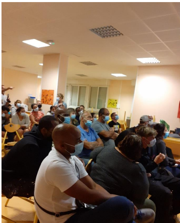
Réunion publique d'octobre 2021

En 2020, Bordeaux Métropole a procédé à des travaux de viabilisation dans le quartier des Landes de Bellevue à Mérignac. Ces travaux sont intervenus sur le domaine public, au niveau de la voirie sud (réalisation de la chaussée, assainissement pluvial, adduction eau potable, sécurité incendie, réseau électricité jusqu'en limite de propriété).