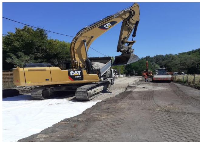
Travaux de raccordement à l'eau