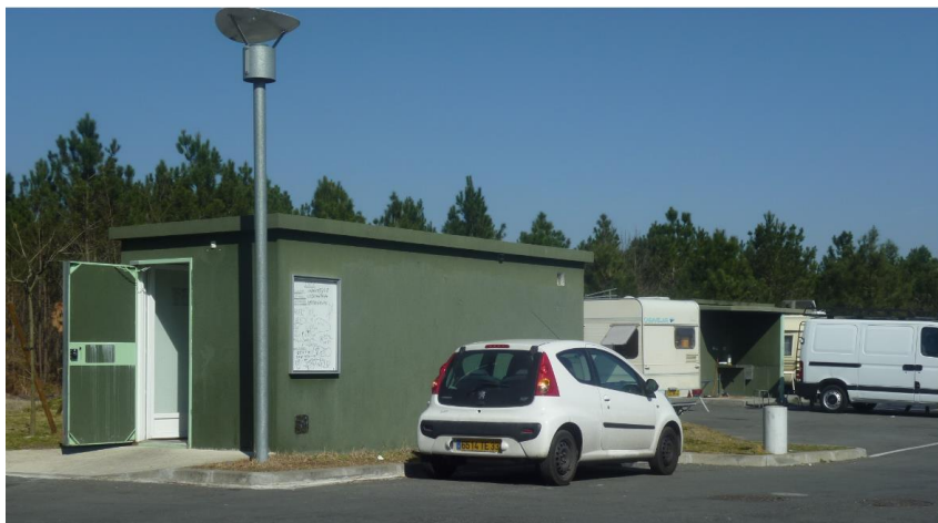
Aire d'accueil du Chemin du Blayais Saint-Jean-d'Ilac