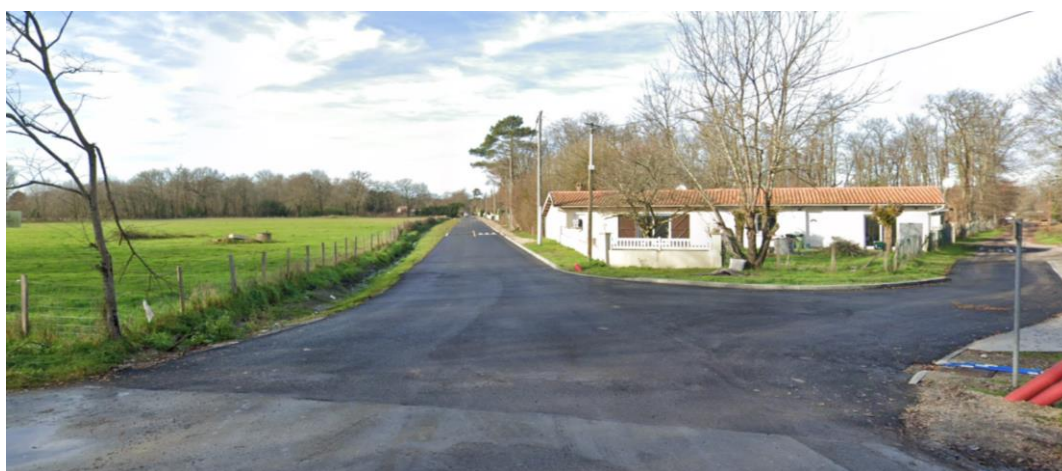
Chemin de la princesse