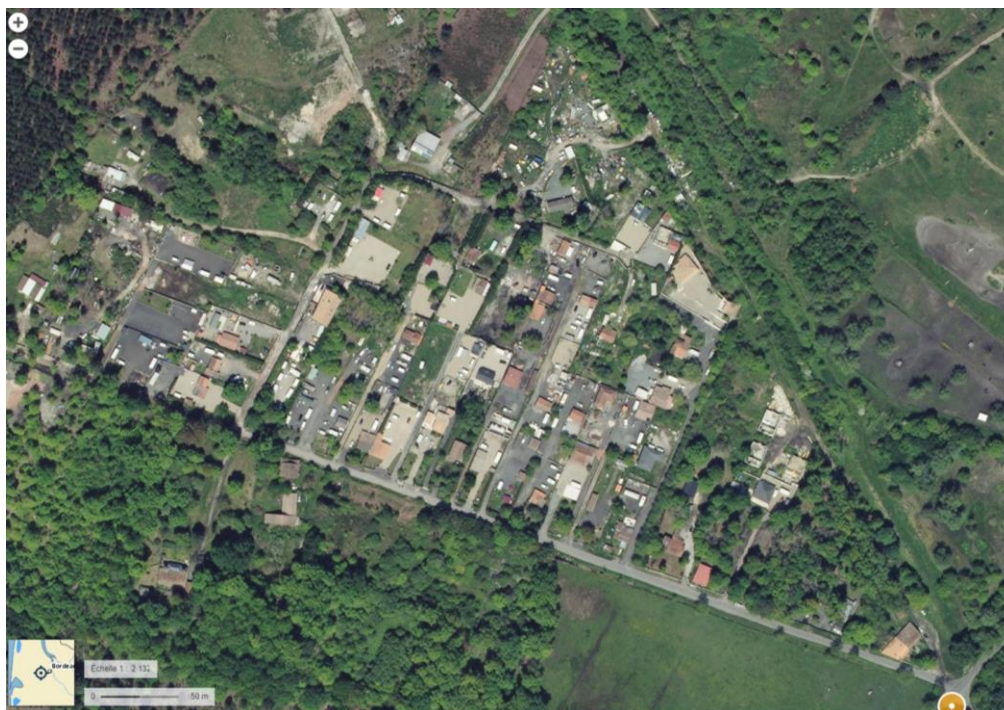
Vue globale

C'est un lieu en transformation : l'étude de réaménagement du site est en cours avec la Mairie, la Métropole et les habitants de ce quartier (interlocuteurs directs de la Mairie). Le périmètre de cette « viabilisation » ne changera pas le caractère inconstructible de ces terrains.