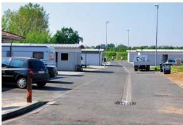
Aire d'Eysines- Le Haillan