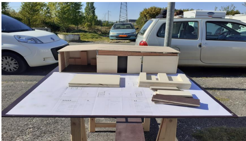
Projet de réhabilitation de l'aire d'accueil Atelier participatif animé par le collectif Cancan – avril 2021

Participation aux COPIL, animation COTECH.