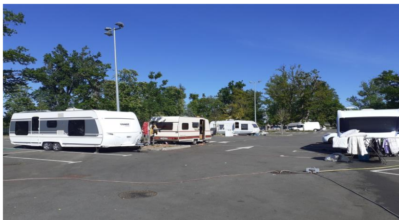
Stationnement précaire Bassens - Avril 2021