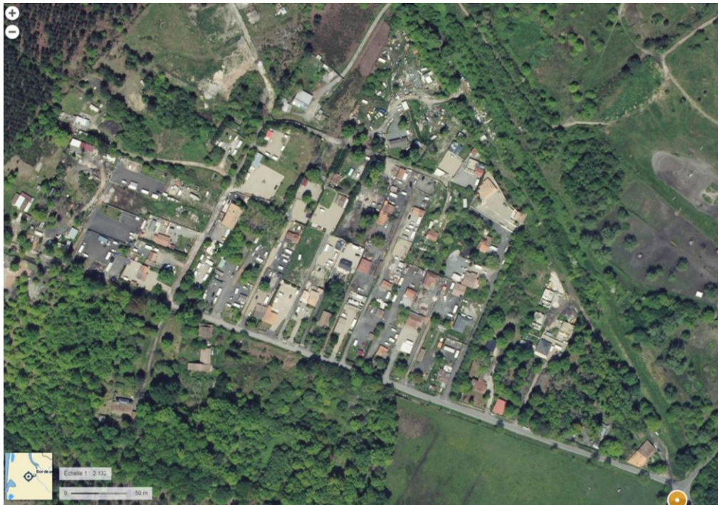
Vue globale

C'est un lieu en transformation : l'étude de réaménagement du site est en cours avec la Mairie, la Métropole et les habitants de ce quartier (interlocuteurs directs de la Mairie). Le périmètre de cette « viabilisation » ne changera pas le caractère inconstructible de ces terrains.